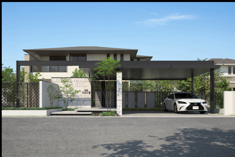
フレーム・屋根枠・天井材：ブラック／熱線遮断ポリカーボネート板（かすみ調）