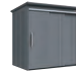
ブリッシュグレー (GR)