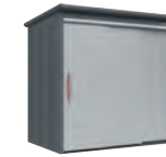
ルミナスシルバー (LS)