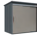
アンバーゴールド (AB)