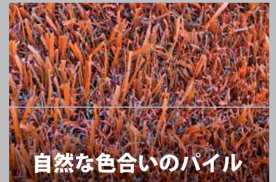
自然な色合いのパイル