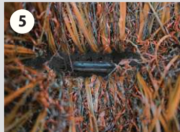
5 ボンド接着後、パイルを挟まないようピンを溝に沿って固定していきます。