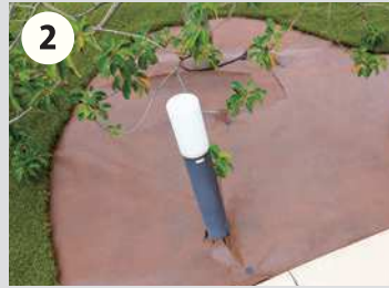
2 雑草防止効果のあるシートを敷設します。