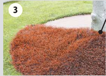
3 敷地の形状に合わせてリアリーターフ® マスターズパークを仮置きします。