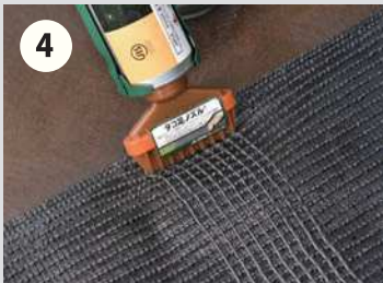
4 仮置きが終了したら、位置がずれないようにリアリーターフ® マスターズパークをめくり、裏に専用ボンドを塗布します。