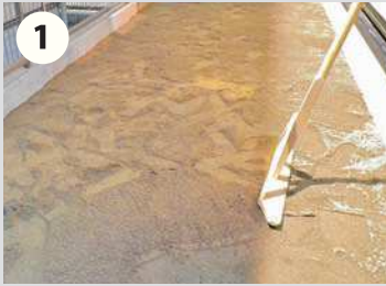
1 あらかじめ施工する場所の雑草をある程度取り除き整地します。