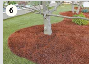
6 残ったパイルなどを除去、清掃し、パイルをトンボや手で立たせてください。