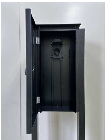
製品内部イメージ