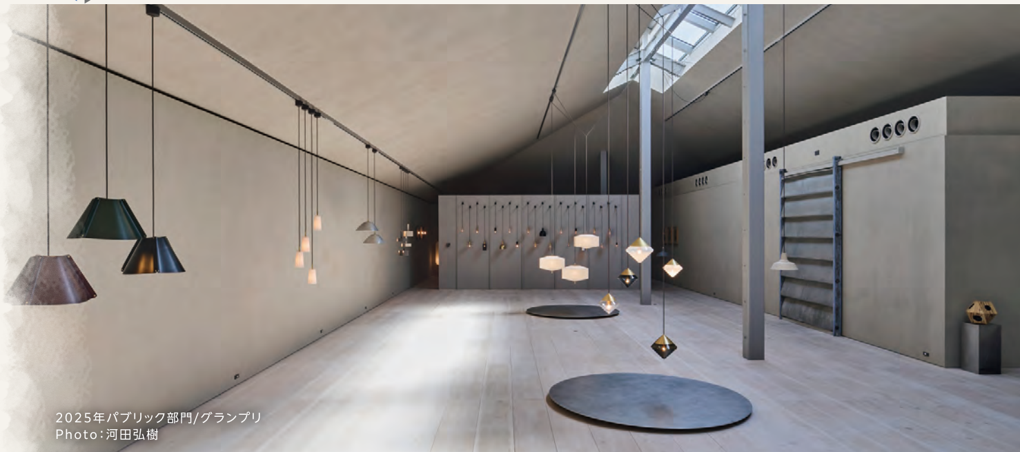
2025年パブリック部門/グランプリ