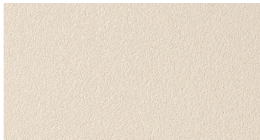
カラーNo.406 鏡波仕上げ